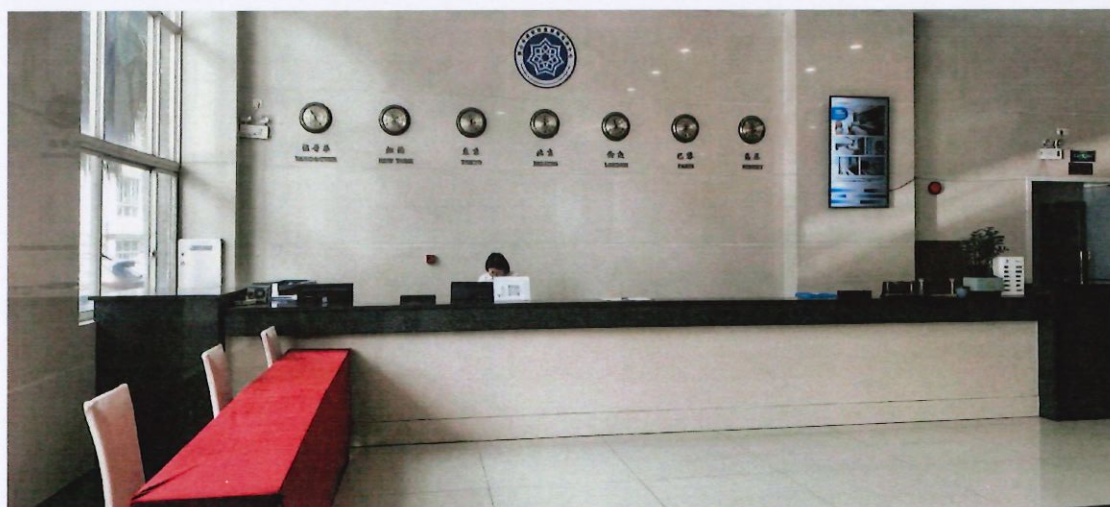
8号楼一楼大堂报到处