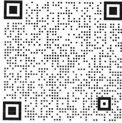
UT (超声) 班