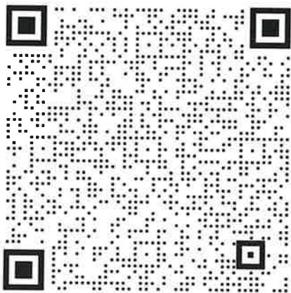
MT (磁粉) 班